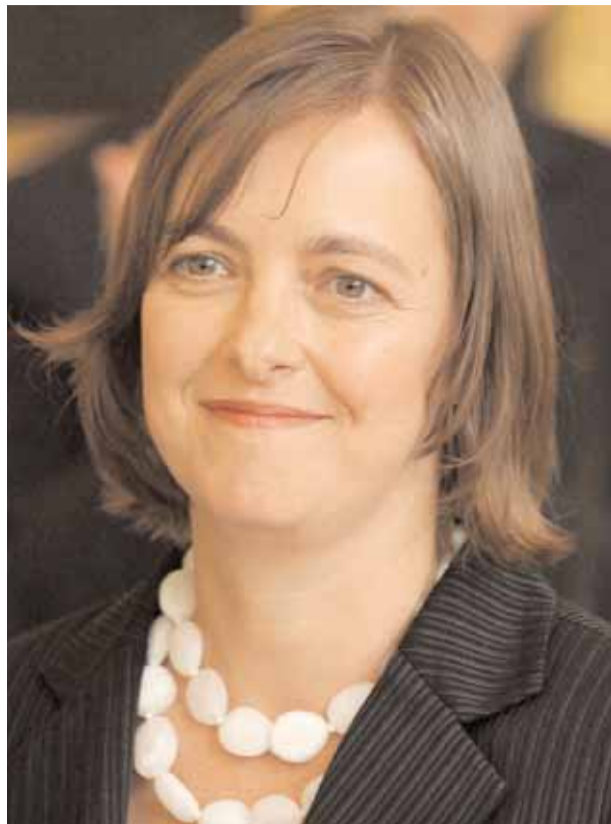
Η κα Ρόξον είπε ότι οι αλλαγές δεν θα κοστίζουν περισσότερα χρήματα στους φορολογούμενους και θα τεθούν σε εφαρμογή από τον Μάιο 2010.