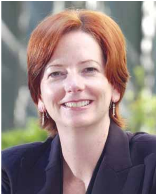
Η κα Γκίλαρντ απέρριψε τον ισχυρισμό ότι οι Εργατικοί υπόσχονται πολλά και κάνουν λίγα.

«Αυτή η κυβέρνηση έκανε μερικές από τις πιο δύσκολες μεταρρυθμίσεις των τελευταίων 30 χρόνων», είπε η κα Γκίλαρντ, αλλά και προειδοποίησε ότι λόγω τής οικονομικής ύφεσης η κυβέρνηση θα πρέπει να είναι προσεκτική με τις δαπάνες τής δυσκολεύοντας τις μεταρρυθμίσεις.